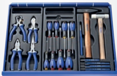
D E F