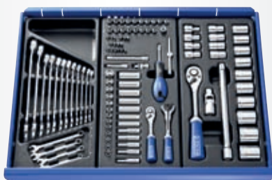
A B C

Cena Kč (bez DPH) 18 556,20 22 453,- (s DPH) + ZDARMA E032939 v hodnotě 2 685,12 Kč (bez DPH) 3 249,- (s DPH)